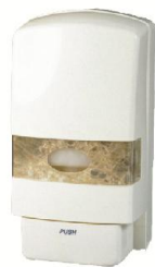
SD 200 R