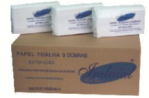
IN 500 Papel Toalha 100% celulose 3 dobras