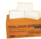
IN 400 Papel Toalha 100% celulose 2 dobras