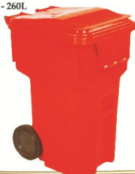
MSD 120L - 260L

120L Altura: 978mm Largura: 480mm Profundidade: 572mm