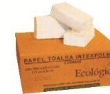
IN 300 Papel Toalha Interfolhado 3 dobras