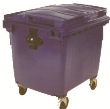
MGB 500L - 1000L

660 Litros Altura: 1180mm Largura: 1360mm Profundidade: 770mm