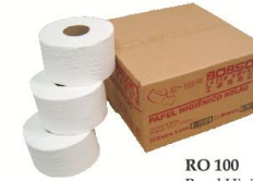
RO 100 Papel Higiênico 100% celulose