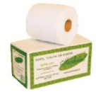
MU 2 Papel Multiuso 100% celulose