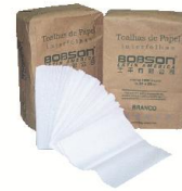
IN 60 Papel Toalha 2 dobras